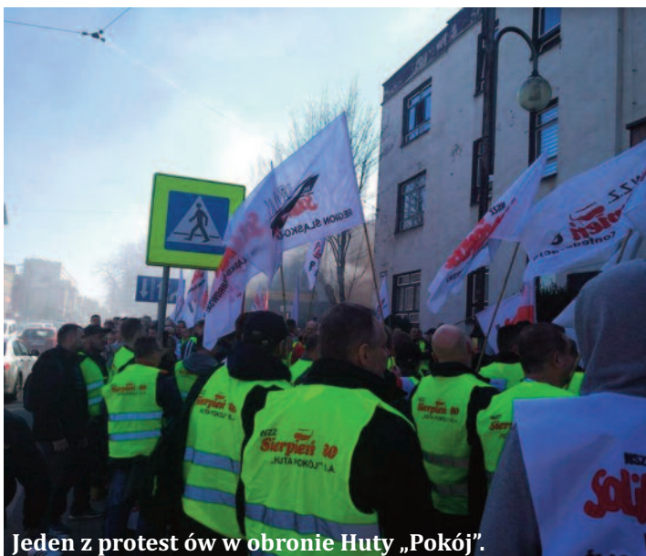
Jeden z protestów w obronie Huty „Pokój”.

Przypomnieć należy, że Huta Pokój S.A. znalazła się w Grupie Kapitałowej WĘGLOKOKS S.A. w 2016 r. WĘGLOKOKS S.A. finansował działalność Huty Pokój S.A. w wyniku czego powstało zadłużenie wobec WĘGLOKOKS S.A. na koniec 2018 r. na kwotę ok. 170 mln zł, włącznie z odsetkami. W celu redukcji części tego zadłużenia, na początku 2019 r. powstał pomysł jego spłaty przez przekazanie majątku produkcyjnego Huty „Pokój” S.A. do spółki WĘGLOKOKS S.A., co miało nastąpić do końca pierwszej połowy 2019 r. Co istotne, przekazanie majątku produkcyjnego miało również umożliwić utrzymanie produkcji. Huta Pokój S.A. do maja 2019 r. prowadziła samodzielną działalność w oparciu o kredyty bankowe, materiały do produkcji kupując za gotówkę poprzez WĘGLOKOKS S.A. lub częściowo samodzielnie, ponieważ służby huty działały bardziej